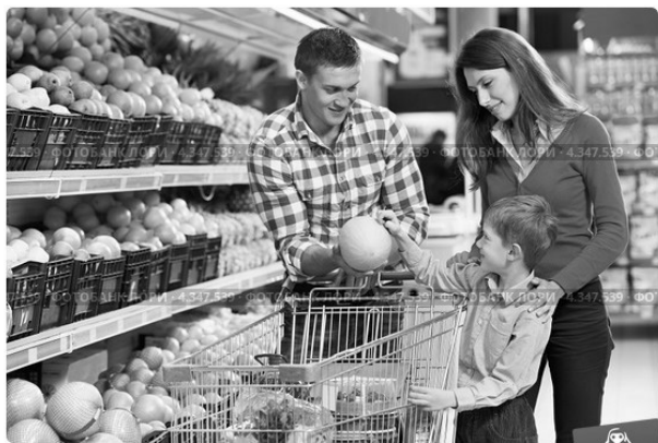
Семья выбирает продукты в супермаркете